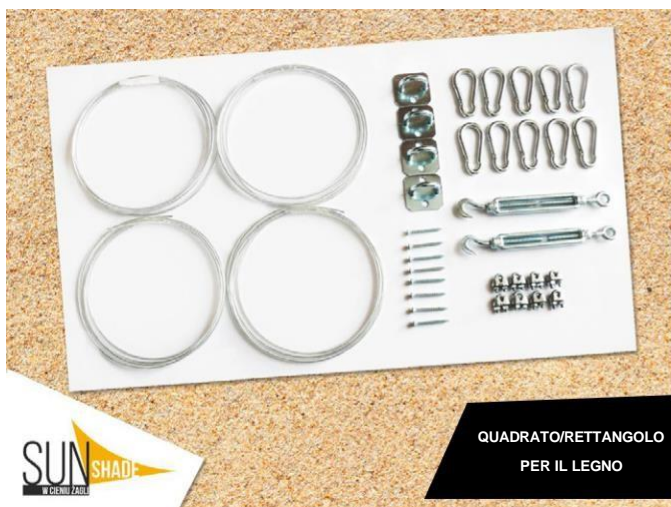
QUADRATO/RETTANGOLO PER IL LEGNO