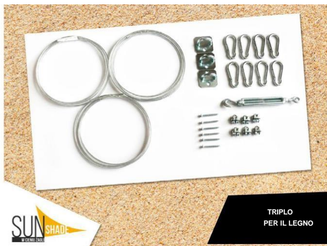
TRIPLIO PER IL LEGNO